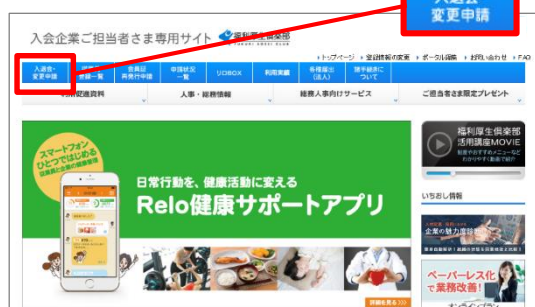
▼ご担当者さま専用サイトTOP画面